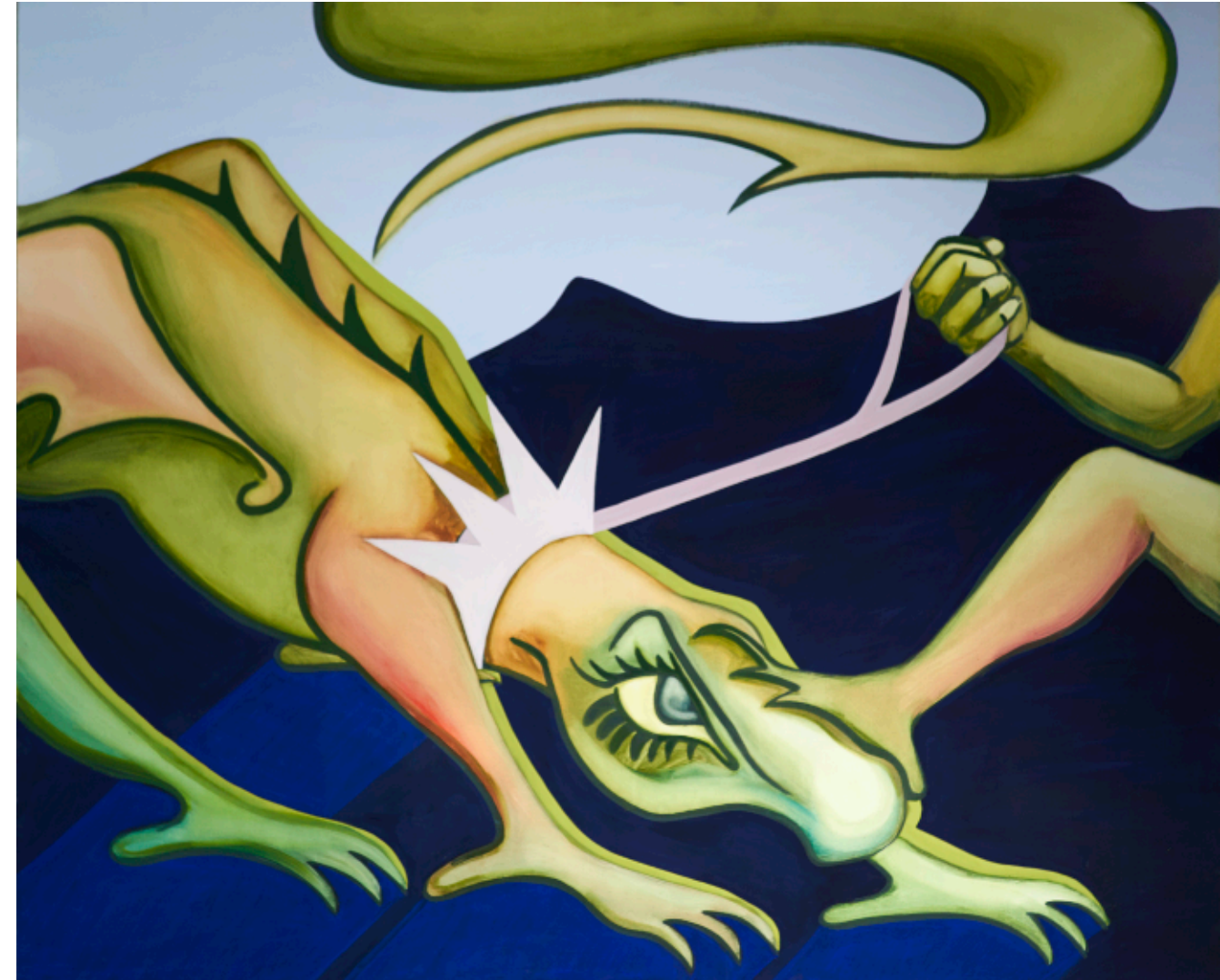
130 × 160 cm tempera i olej na płótnie 2022