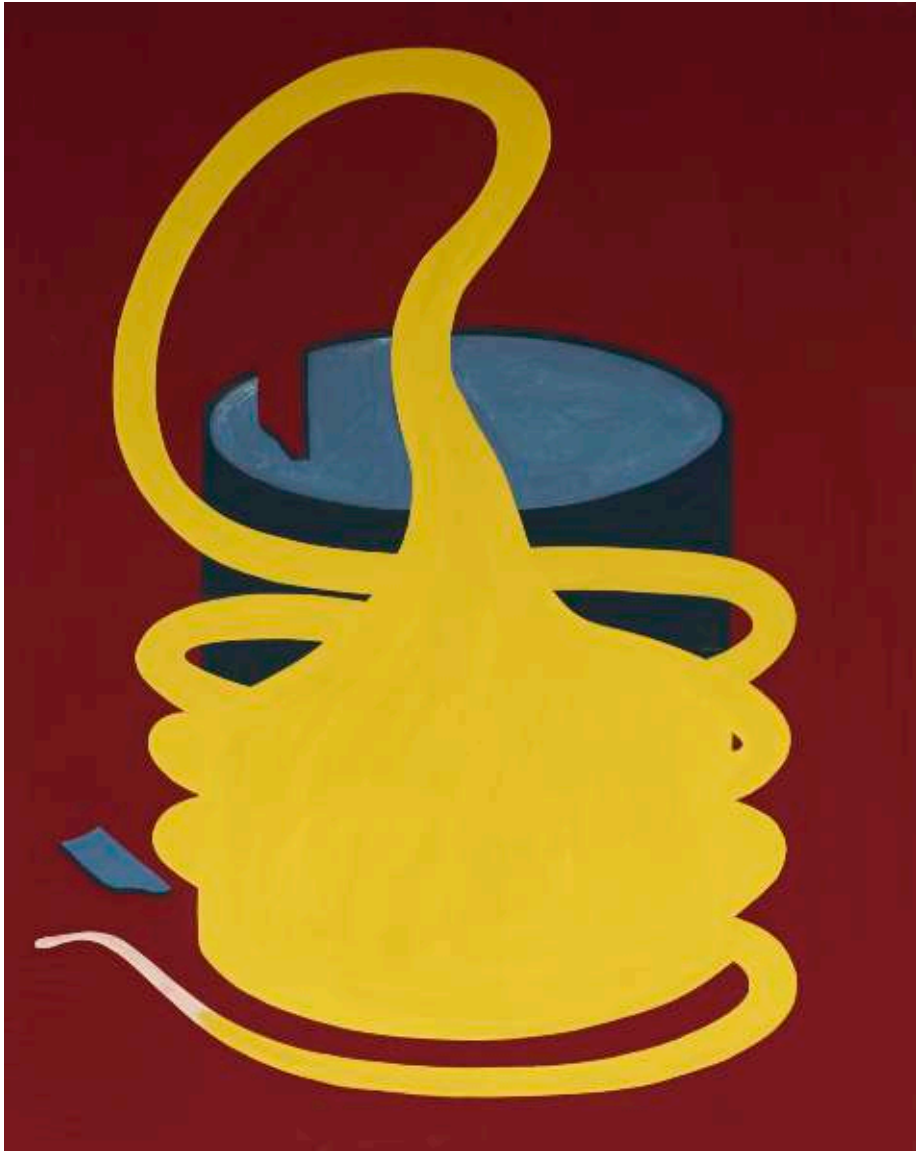
Bez tytułu (roślinka)